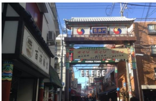
大阪コリアンタウン