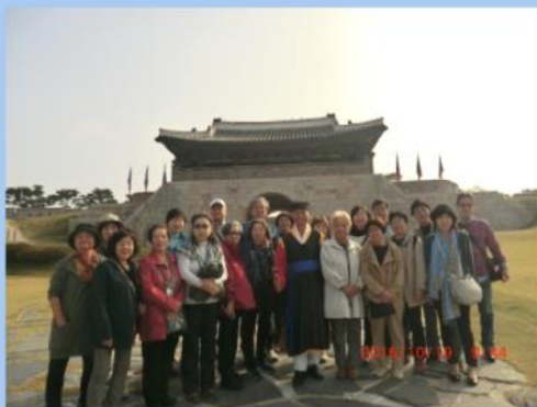
韓国訪問 [華城(水原)にて]