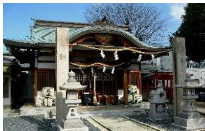
荒田八幡神社 安徳天皇行在所址