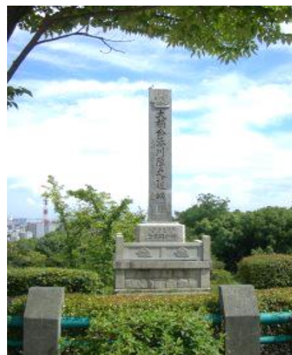
会下山公園 大楠公湊川陣の遺跡碑